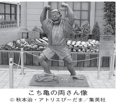
こち亀の両さん像 © 秋本治・アトリエビーだま/集英社

交通安全対策 問 交通安全対策の拡充と一貫した子育て支援体制の構築を。他の質問項目 キャンペーン翼 など