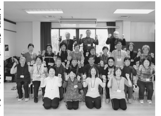
筋力トレーニングに励む自主グループ