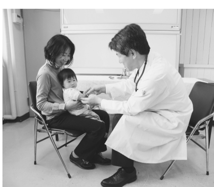
予防接種(イメージ)