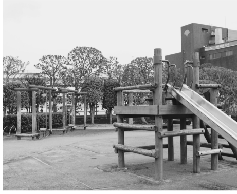
小菅西公園の遊具