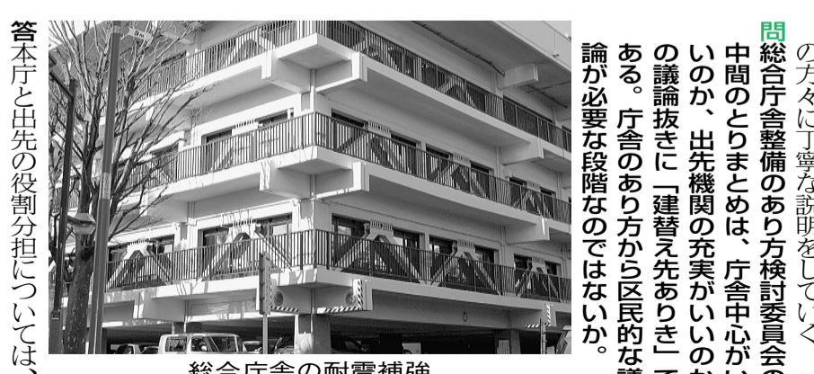
総合庁舎の耐震補強

問国民健康保険料が値上げにならないように軽減すべきと思うがどうか。答状況は減って、保険料負担が増す世帯がある。負担が過大にならないよう2年間の激変緩和策を講じる。