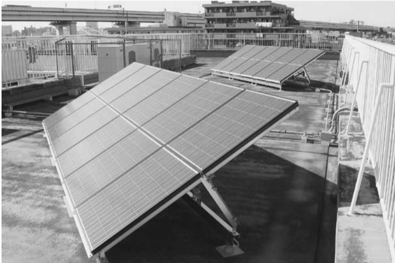
太陽光発電システム・区内小学校

9月18日に開われました第3回定例会本会議におきまして、議員の皆様のご推挙をいただき、議長に就任をいたしました。誠に身に余る光栄であると同時に、その使命と責任の重大さを痛感しているところでございます。現在、日本経済は、サブプライムローンに端を発した米国における金融不安の高まりや株価の低迷を受け、景気の後退が懸念されております。今後、本区における財政運営にも大きな影響を及ぼすものと思えます。一方で、区政は、高齢社会の成熟、少子化の進展、地球規模での環境問題といった、かつて経験したことのない新たな課題にも取り組んでいかなければなりません。こうした中で、私ども区議会も、区政に対して多様な民意を反映させ、区民サービスの向上に努めるとともに、区民の皆様にご理解いただけますよう議会の活性化を図り、開かれた議会を目指してまいります。