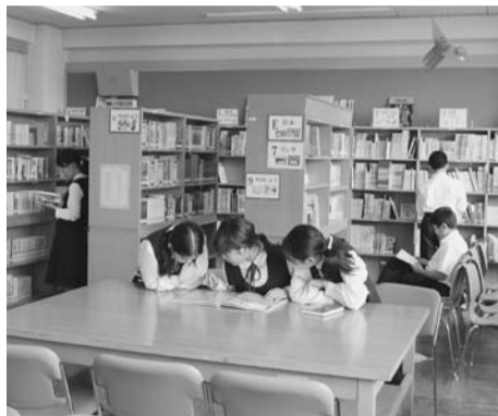
学校図書館・区内中学校

答 実施するためにはかなりの経費がかかることや、他の市町村を見ても利用状況が少ないことから、コンビニエンスストアを利用した図書館サービスについては将来的な検討課題であると考えている。