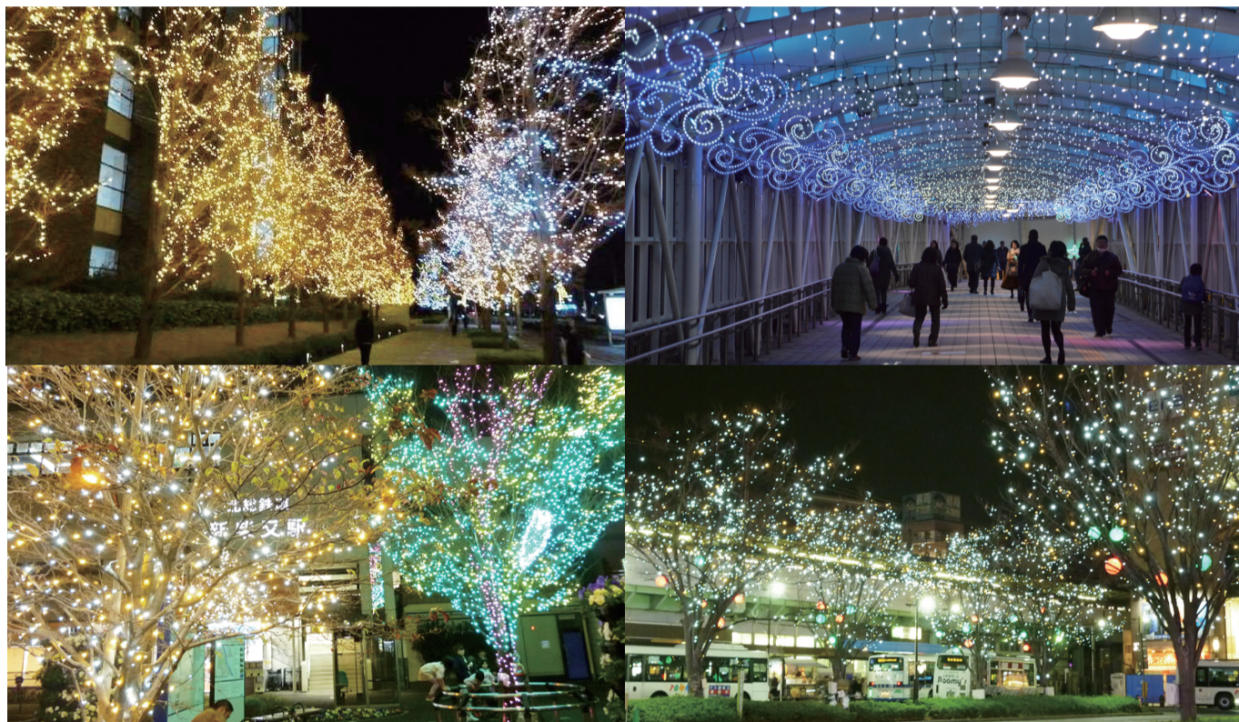
葛飾を彩るイルミネーション（左上：金町、右上：新小岩、左下：柴又、右下：亀有）

No.243 令和2年（2020年） 1月25日発行 葛飾区議会 〒124-8555 葛飾区立石5-13-1 ☎3695-1111 FAX5698-1543