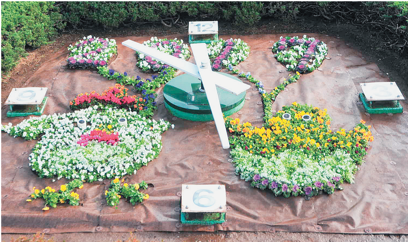
小菅西公園の花時計

No.230 平成29年（2017年）1月25日発行 葛飾区議会 〒124-8555 葛飾区立石5-13-1 ☎3695-1111 FAX5698-1543