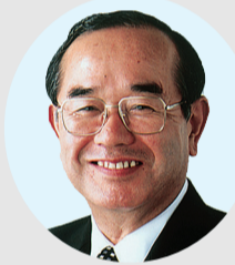
小用 進 青戸 7-18-4