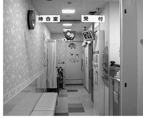
病児保育室「わんぱく」

葛飾区議会公明党 河川空間を利用した観光施策と 学校施設の耐震補強 問河川空間を利用した観光施策と学校施設の耐震補強