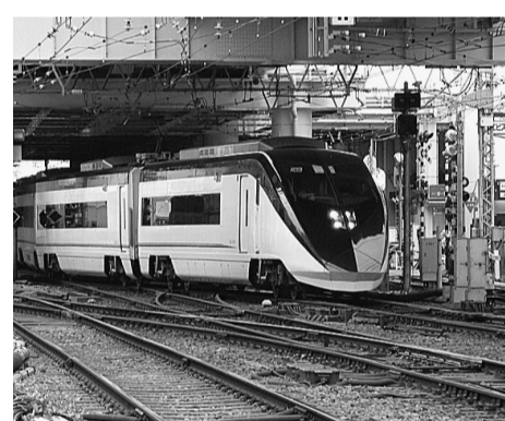
高砂駅高架下を通過する新型スカイライナー