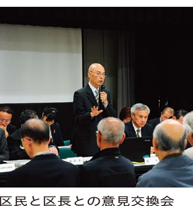
区民と区長との意見交換会

葛飾の新たな観光施策 問 キャンパスの展示物を購入予定だが、その価値と品目について伺う。 答 キャンパスの展示物として「南葛市」のジオラマなどを約30点を購入予定である。これらの中で唯一の品目が新たな観光資源となり、「キャンパス」の魅力をより一層PRすることが可能になると考える。