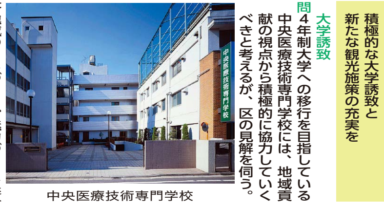
中央医療技術専門学校

大学誘致 問 4年制大学への移行を目指している中央医療技術専門学校には、地域貢献の観点から積極的に協力していくべきか。 答 地域貢献の観点から、魅力づくりに資する協力関係を構築し、大学移行の計画進捗に合わせ、どのような協力ができるのかなどを検討していく。