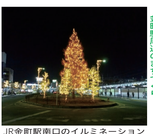
JR金町駅南口のイルミネーション