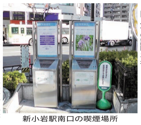
新小岩駅南口の喫煙場所

問 区政運営に反映していくかを伺う。答へは、区政運営に反映していくことを目指している。関係する関係機関との調整や区民への説明を行う。